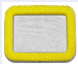
Fliegengitter zum Nachrüsten (gegen Aufpreis)