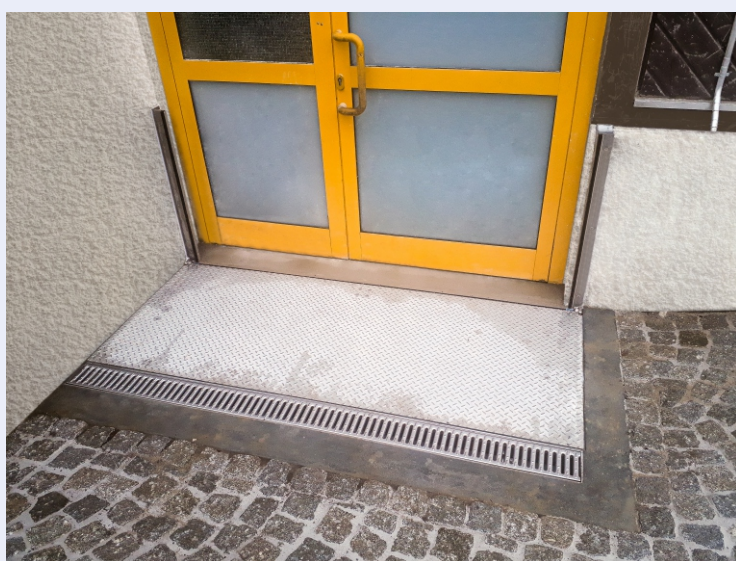
CHT-MINI Klappschott in Sicherheitsposition

Wir garantieren einen sicheren Hochwasserschutz!