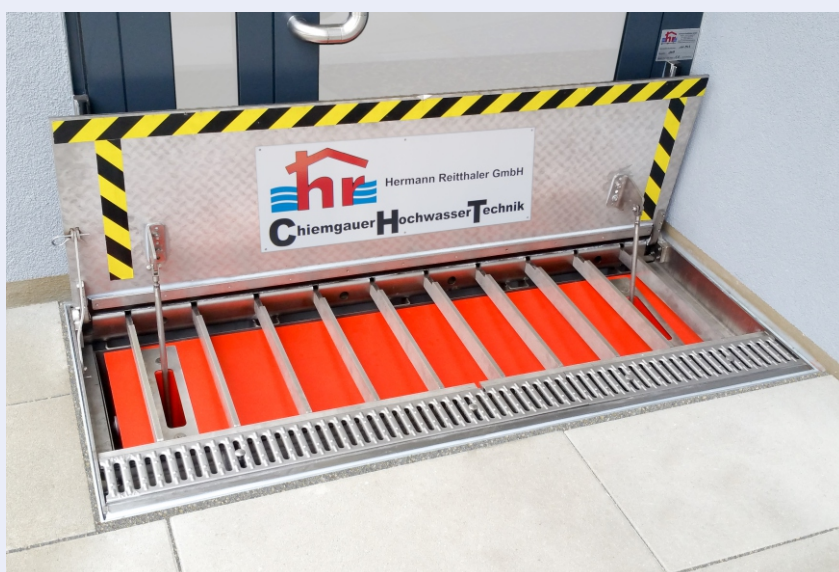
Vollautomatisches CHT-Sicherheitsklappschott in Hochwasserschutzposition