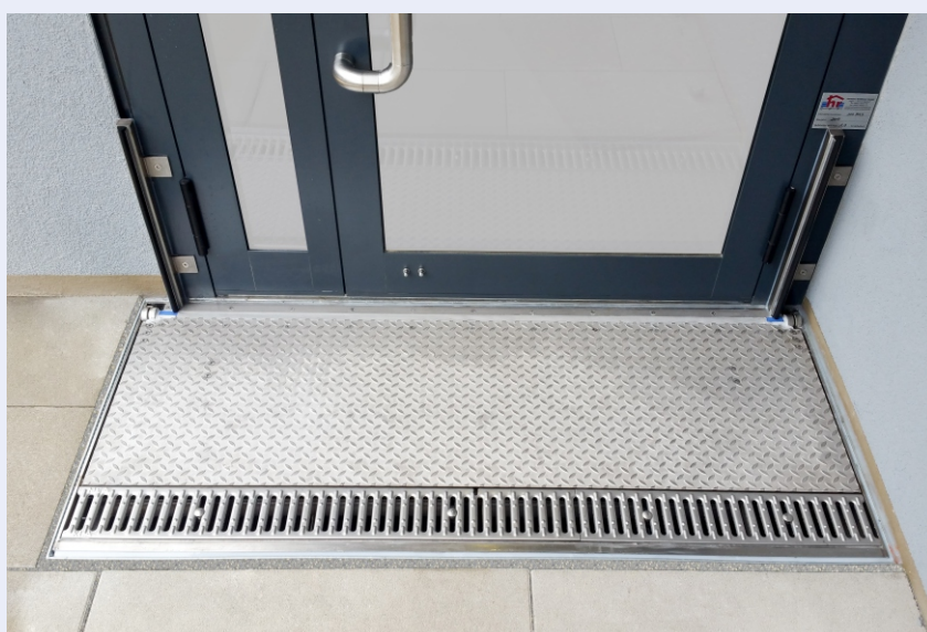
Vollautomatisches CHT-Sicherheitsklappschott in Sicherheitsposition

Dank innovativer Schwimmertechnik öffnet und schließt dieses System selbstständig, stromunabhängig und ohne auf sonstige Fremdenergie* angewiesen zu sein.